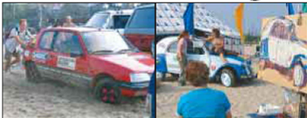
VASTLOPENDE WIELEN en brullende motoren.

Het gaat er niet om hoe laat je aankomt, maar dát je aankomt. En dat is meteen de grootste uitdaging voor de bijna vijfhonderd deelnemers aan de Amsterdam-Dakar Challenge. Gisteren verzamelden de avonturiers zich op het hippe Strand West in Amsterdam. Erg vlotjes verliep het eerste contact van de barrels met het rulle strandzand echter niet: vastlopende wielen, brullende motoren en loszittende wielen. Hortend en stotend parkeerden de bestuurders hun voertuig ter waarde van niet